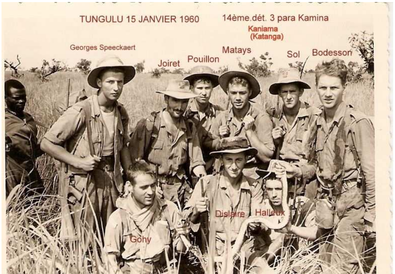
TUNGULU 15 JANVIER 1960